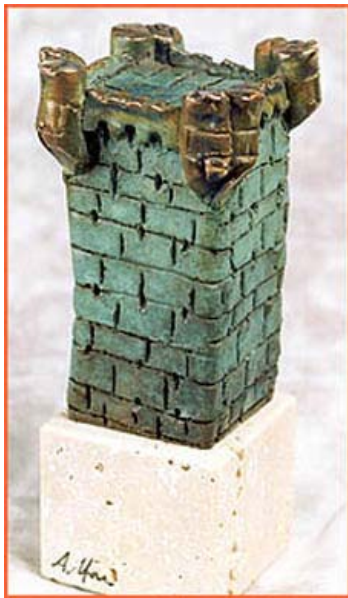
Torre del Homenaje