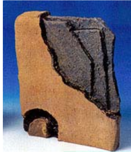
Escultura abstracta 2