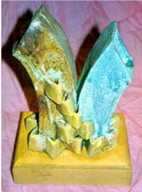
Escultura abstracta 1