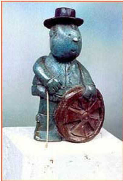
Señor con rueda de carro.