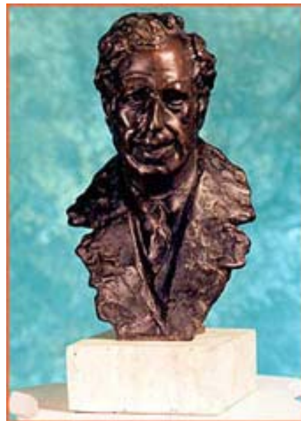
Busto JULIAN BESTEIRO